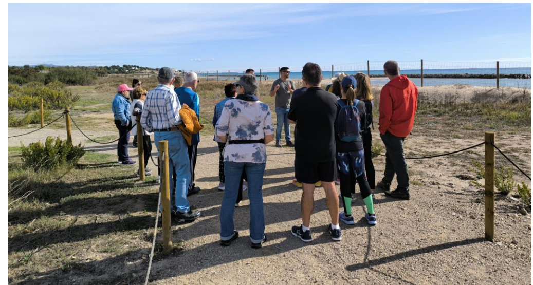
Platja Llarga. 2025

Después de la pandemia, en concepto de la emergencia Climática cada vez es mas relevante. Aporta un relato mas amplio que el concepto conservacionista. Bajo este concepto se esta profundizando en sus valores ambientales y su gestión cotidiana.