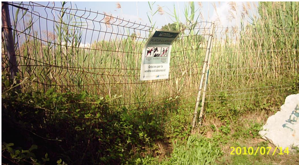
Platja Llarga. 2010

El Servicio de Medio Ambiente del Ayuntamiento inició su trabajo en las playas municipales en el año 2006 con la finalidad de conservar los valores naturales municipales. Bajo este concepto se preservaron y restauraron tres de las playas con mas potencial de Vilanova i la Geltrú.